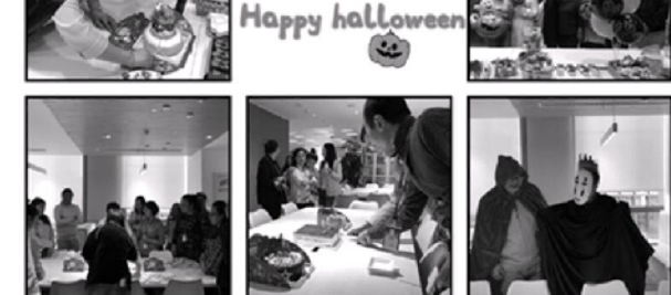
图:员工团建活动 公司定期组织员工团建活动,培养积极向上、团结协作的工作氛围,在创造经济价值的同时,也创造和谐快乐的文化生活。

公司重视与供应商的合作,秉承合作共赢的原则,积极履行社会责任,不仅是爱婴室秉持的经营理念,也是公司在企业经营过程中想传递给社会的一种价值观。