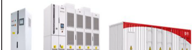
通用型变频器, 工程型变频器系统