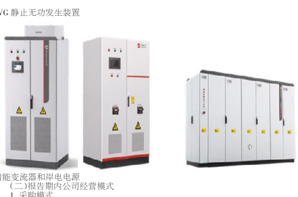
SVG静止无功发生装置, 储能变流器和岸电电源

3. 面临终止上市的情况和原因 4. 公司对会计政策、会计估计变更原因及影响的分析报告 5. 本年度报告摘要来自年度报告全文,为全面了解本公司的经营成果、财务状况及未来发展规划,投资者应当到上海证券交易所网站等中国证监会指定媒体上仔细阅读年度报告全文。