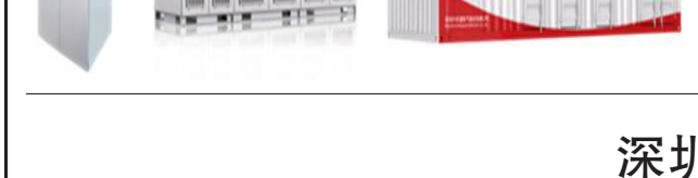
风力发电移动通过平台

2. 太阳能发电及光伏逆变器行业概况 太阳能是各种可再生能源中最重要、最丰富的基本能源。受益于太阳能发电技术水平不断提高,发电成本不断下降,上下游产业更加成熟,应用方式更加灵活多样等多种原因,我国的光伏发电装机容量占比逐年上升。