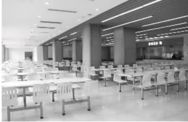
集团总部及下属企业开办了员工食堂,给力保障员工的衣食住行