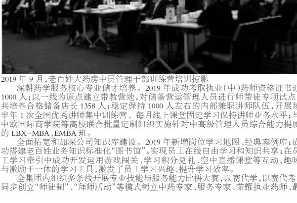
2019年9月,老百姓大药房中层管理干部训练营培训合影