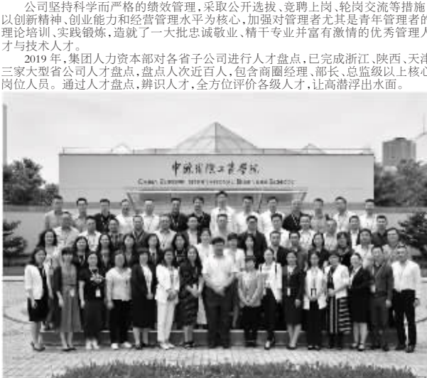
2019年8月,老百姓大药房高级管理人员在中欧国际工商学院开班开班合影