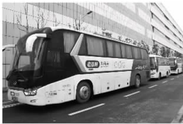
开通员工班车,提供住房补贴及交通补贴,保证员工都能安居乐业