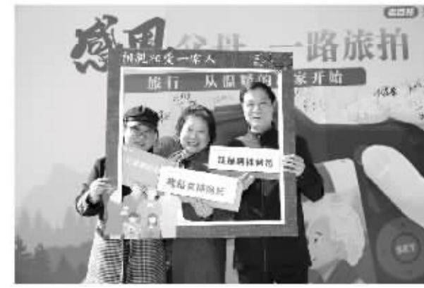
2019年10月,组织“感恩父母一路旅行”活动,给员工一次与父母一起旅行的机会

截至2019年12月31日,“千万困难救助基金”共救助了110多户发生急难或遭遇突发情况的员工家庭,救助金额达189万多元。