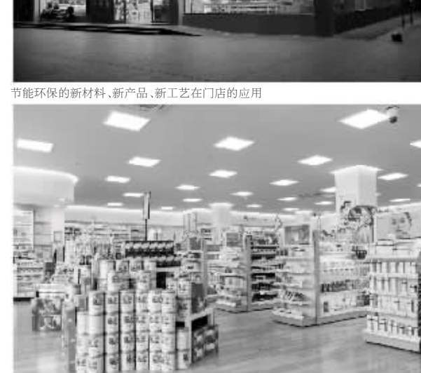
节能环保的新材料、新产品、新工艺在门店的应用