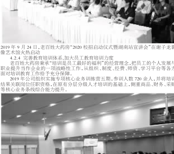
2019年9月,老百姓大药房中层管理干部训练营培训合影