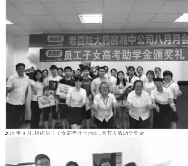
2019年8月,组织员工子女高考升学活动,为其发放助学金