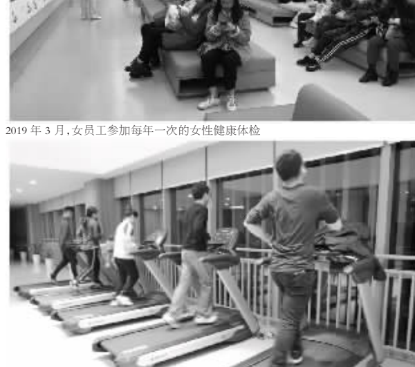
2019年3月,女员工参加每年一次的女性健康体检