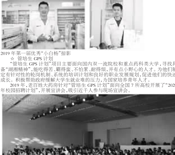
2019年9月24日,老百姓大药房2020校招启动仪式暨湖南站宣讲会