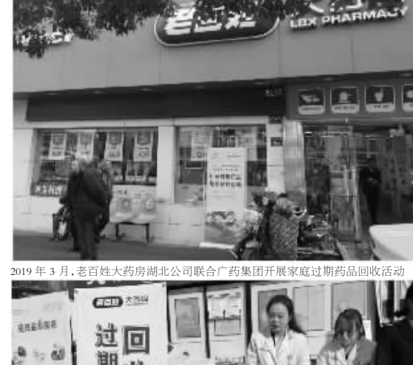
2019年3月,老百姓大药房湖北公司联合广药集团开展家庭过期药品回收活动