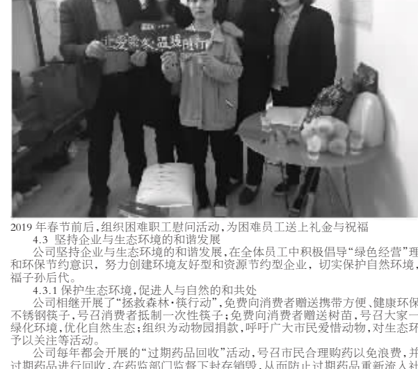
2019年春节前后,组织困难职工慰问活动,为困难职工送上礼金与祝福