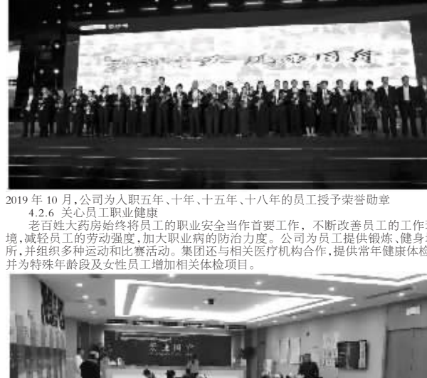
2019年10月,公司为入职五年、十年、十五年、十八年的员工授予荣誉勋章