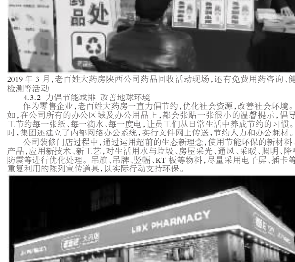
2019年3月,老百姓大药房陕西公司药品回收活动现场,还有免费用药咨询、健康体检等活动