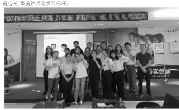
2019年9月,老百姓大药房新员工第五期培训合影留念