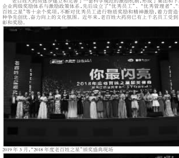
2019年3月,“2018年度老百姓之星”颁奖典礼现场