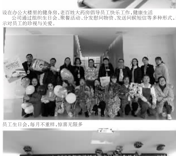
员工生日会,每月不重样,惊喜无限多