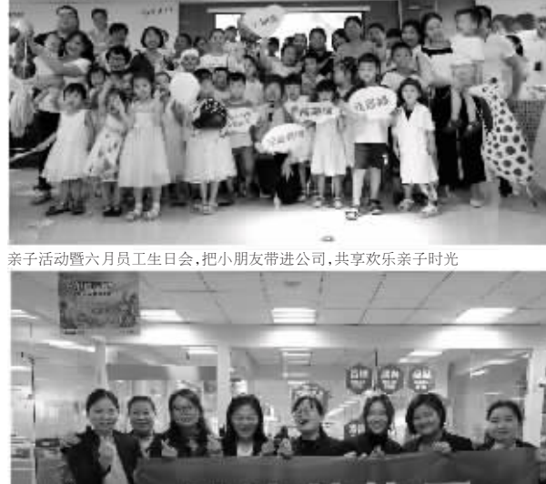
亲子活动暨六月员工生日会,把小朋友带进公司,共享欢乐亲子时光