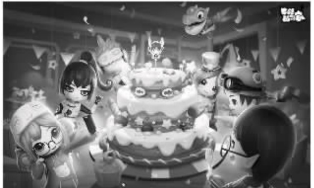
7. 《伊洛哈》是一款由自主研发的轻松休闲战斗手游,游戏玩法,道具,战斗模式,对话等都有趣,是一款好玩的休闲战斗手游。