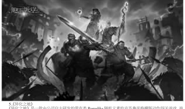
5. 《伊洛哈》是一款由自主研发的带有美 Roguelike 随机元素的克苏鲁风格横版动作闯关游戏,游戏特色包括随机化的地图场景,会议用随机获得的装备,道具击败游戏中的怪物,离开关卡之地将后随的怪物,《伊洛哈》于2019年5月16日登陆iOS,上线后迅速成为App Store 游戏付费榜第24名。