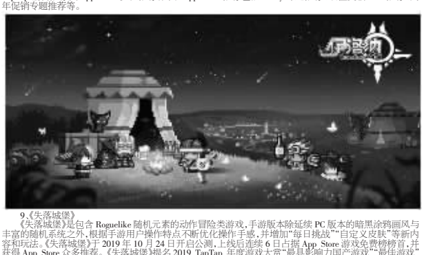
9. 《失落城堡》是一款横版动作闯关类游戏,手游版除传统PC版本的暗黑画风与丰富的剧情之外,还增加了更多关卡和道具,增加了游戏的可玩性。