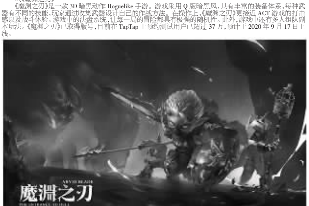
11. 《魔渊之刃》是一款3D动作游戏,游戏玩法,道具,战斗模式,对话等都有趣,是一款好玩的休闲战斗手游。