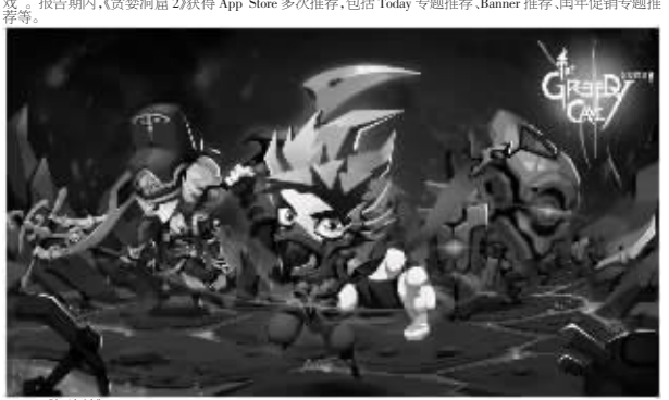
8. 《伊洛哈》是一款自由度的日式RPG手游,是日本十年复刻版的Roguelike角色扮演的游戏(Eloha)正版权授手游,保留基本玩法乐趣的同时在画面、操作和剧情上实现了全面提升。