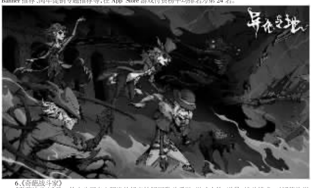
6. 《伊洛哈》是一款策略游戏,保留战略玩法乐趣的基础上,去掉了战略游戏中的角色移动,游戏中玩家操控部队,通过策略和战术击败敌人,获得游戏中的胜利。