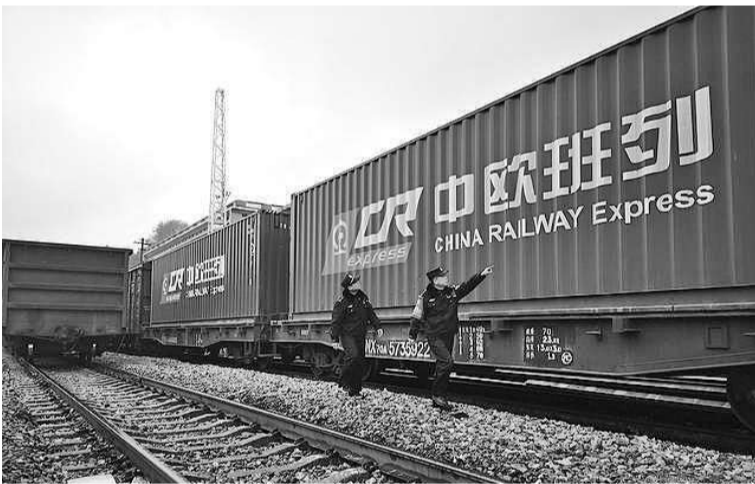
在长沙货运中心等待检验发行的中欧班列