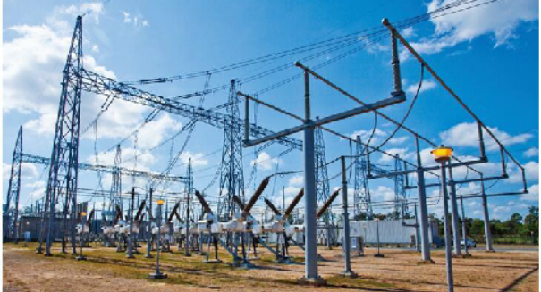
图2: 变电站是电力系统的重要组成部分,承担着电能变换和分配的任务,对保障电网安全稳定运行至关重要。