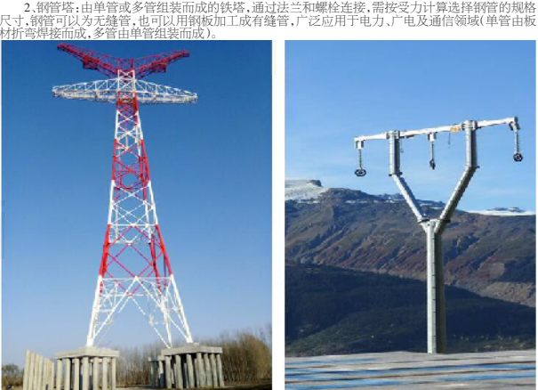
图1: 2020年,公司承接了多个大型输电线路工程,展示了公司在电力设备制造领域的实力和生产能力。