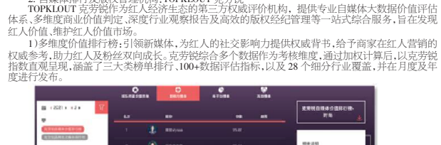
图:WEIQ红人营销平台—概览SaaS工具直播分析界面