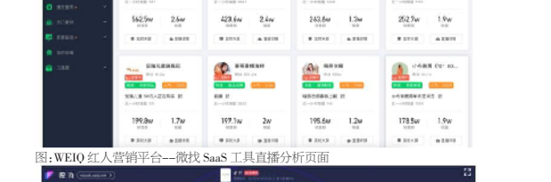
图:WEIQ红人营销平台—概览SaaS工具直播分析界面