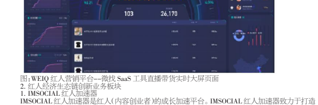
图:WEIQ红人营销平台—概览SaaS工具直播分析界面