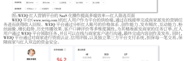
图:WEIQ红人营销平台的SaaS化操作提高多端效率—红人主页面