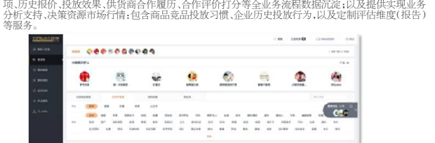
图:克劳锐红人营销平台

2.红人营销平台:红人营销平台(简称:WEIQ平台)是基于大数据技术为红人(内容创作者)与企业提供红人营销服务的撮合与交易平台,核心业务逻辑为:将有营销需求的企业与有营销能力的红人建立连接,红人通过内容创作,精准触达目标受众,帮助企业实现营销目标。