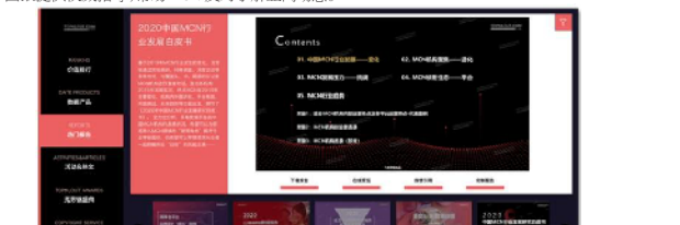
图:TOPKLOUT克劳锐小程序发布的部分行业报告

2.行业报告:全方位多角度深度洞察新媒体行业趋势,洞察不同领域红人营销价值,为商家投资回报提供决策支持,帮助MCN及时了解行业动态。