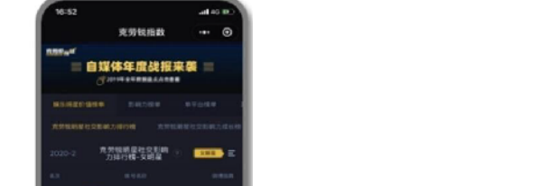
图:克劳锐指数-微信小程序

3.克劳锐数据产品: 1.克劳锐指数-微信小程序:整合克劳锐榜单,覆盖50+自主标签体系,80万+账号,日更新数据200万+,免费向用户提供数据查询服务。