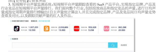
图:克劳锐红人营销平台

3.短视频平台:短视频平台是短视频领域的SaaS产品平台,主要提供品牌、产品及行业竞品在短视频平台上的营销推广服务。我们面向整个行业,包括投放商品和特定品牌的声音,进行日均声量及品牌声量排行榜(自主声量统计算法),并且完成指定品牌、产品及竞品在短视频平台上的声量趋势查看及对比,以及品牌声量趋势的对比。