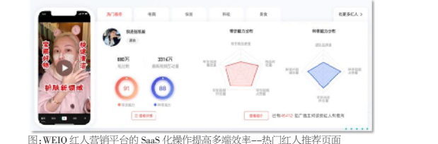
图:WEIQ红人营销平台的SaaS化操作提高多端效率—红人推荐界面

1. 红人营销平台 WEIQ WEIQ红人营销平台(简称:WEIQ平台)是基于大数据技术为红人(内容创作者)与企业提供红人营销服务的撮合与交易平台,核心业务逻辑为:将有营销需求的企业与有营销能力的红人建立连接,红人通过内容创作,精准触达目标受众,帮助企业实现营销目标。