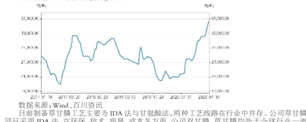
数据来源:Wind,百川盈信 数据说明:草甘膦行业主要工艺为IDA法与甘氨酸法,两种工艺线路在行业中并存,公司草甘膦项目采用IDA法,在环保、技术、质量、成本各方面,公司草甘膦、草甘膦均处于全球行业一流水平。

本市场助力,发展实业,服务于社会,回报股东。 公司秉承“技术领先,成本领先”的竞争策略,以:全球一流的技术,一流的产品质量,一流的制造成本为核心指导思想,并通过工艺创新、资源综合利用,发展循环经济,坚持环境友好,绿色可持续发展的原则。