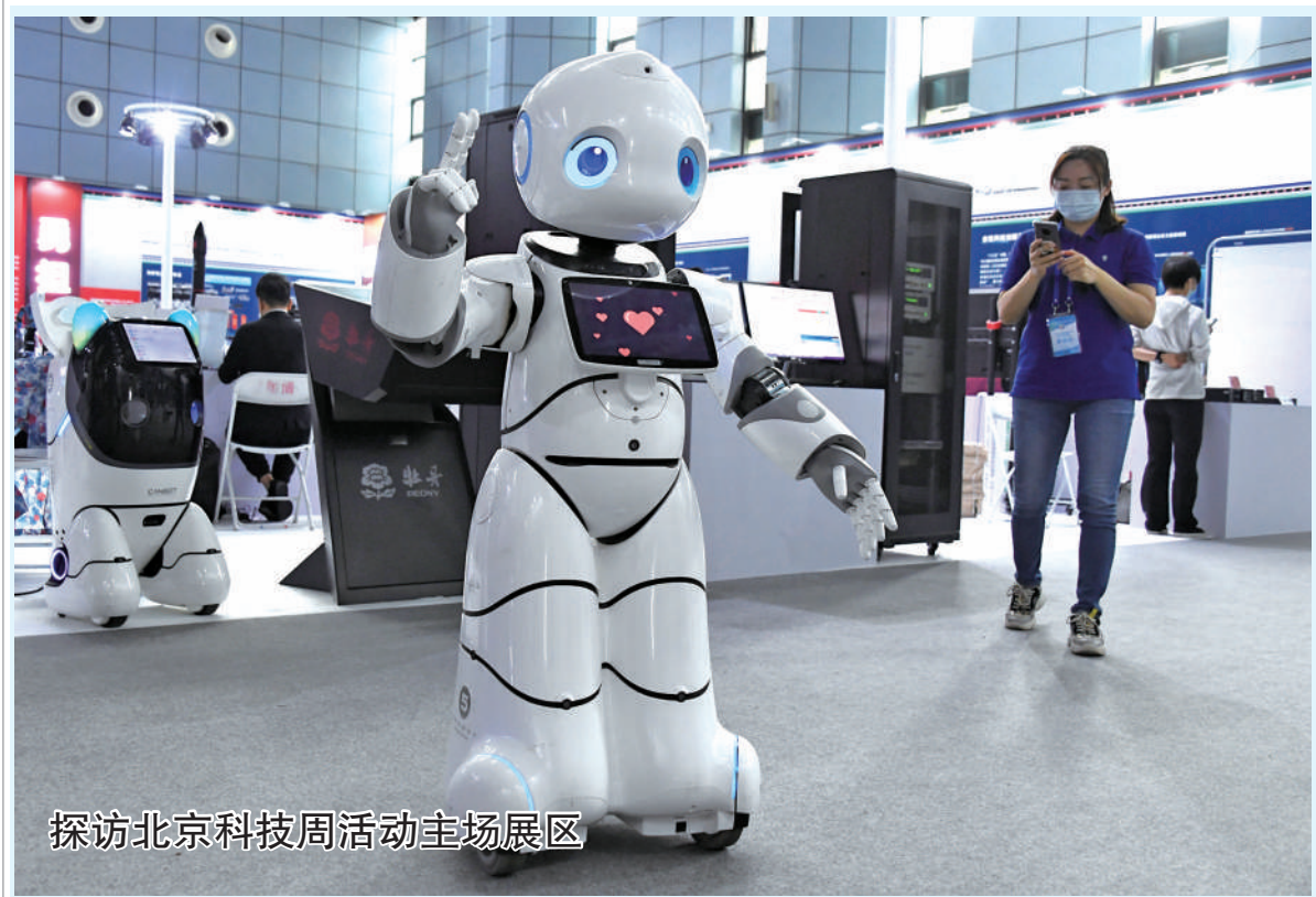
探访北京科技周活动主场展区

参会企业和行业协会表示,将按照约谈提醒要求,认真规范生产经营行为,切实履行社会责任,坚持依法依规经营,为营造和谐稳定的市场和价格秩序做出积极贡献。