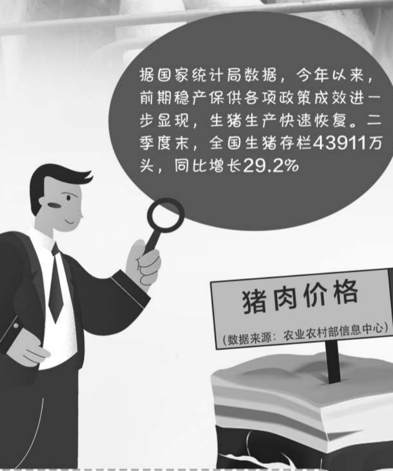
近一个月以来猪肉价格变化