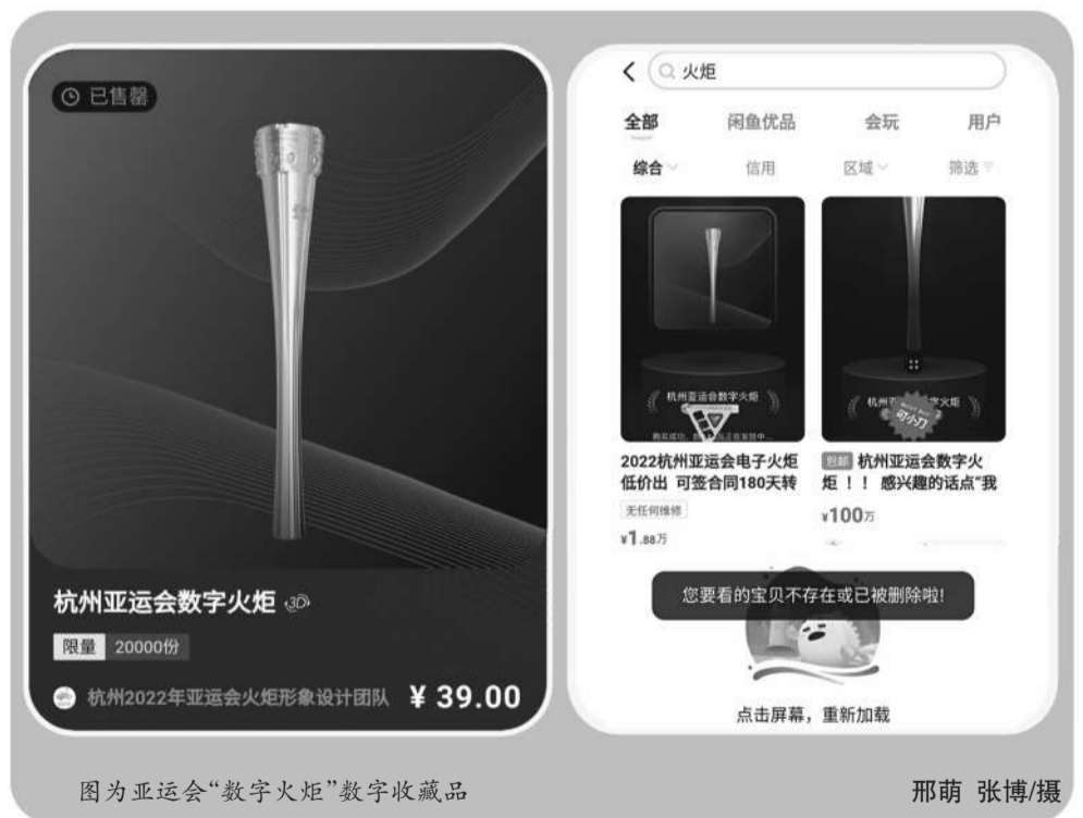
图为亚运会“数字火炬”数字收藏品

“NFT的价值在于能在数字时代利用区块链技术去表明数字物品的权属，这对于数字世界的基础设施的建设具有重大意义。”深圳市信息服务业区块链协会会长郑定向《证券日报》记者表示，NFT重新定义了数字时代艺术品的收藏概念，为人们展示了数字世界新的生活方式的可能性，同时也降低了参与数字世界构建的门槛，这是NFT被看好的重要原因。