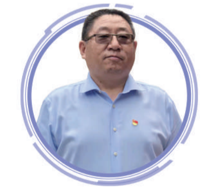
北京证监局党委书记吴运浩