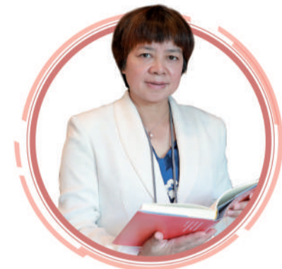
北京证监局局长贾文勤