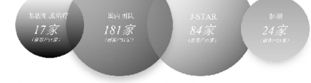
图2.服务客户及新客户数 2021年,公司通过市场推广和营销推广,持续夯实在国际市场的行业地位,同时在国内市场初步建立了良好的品牌影响力。2021年,公司服务客户数(仅含报告期内新增客户)的占比,不高于 STAR 合计41.0%,同比增长14%。其中,209个项目处于临床前及临床一期,65个项目处于临床二期,44个项目处于临床三期,10个项目处于上市申请阶段,87个项目处于上市阶段(详见图3)。公司引入新产品212个(不含 STAR),新产品(不含 STAR)新增收入占2021年营业收入的比例约29%。报告期内,公司前十大产品占比达37%。

(1)通过持续提升客户深度和广度,不断拓展客户管线 2021年,公司持续加大市场推广和商务拓展,引入新客户113家,其中原料药 CDMO 业务新客户76家,制剂 CDMO 业务新客户23家,基因细胞治疗 CDMO 业务新客户10家。报告期内,公司服务客户户数(仅含新客户)达127家(详见图2)。报告期内,前十大客户占比达63%。