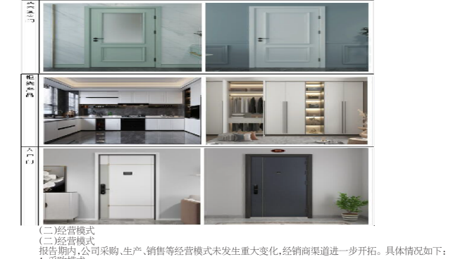
报告期内,公司采购、生产、销售等经营模式未发生重大变化。

3.公司目前生产经营一切正常，市场环境或行业政策没有发生重大调整，生产能力和销售情况与市场预期相符，不存在任何异常波动或异常交易行为。