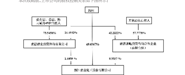
本次收购后, 上市公司的股权结构控制关系如下所示: