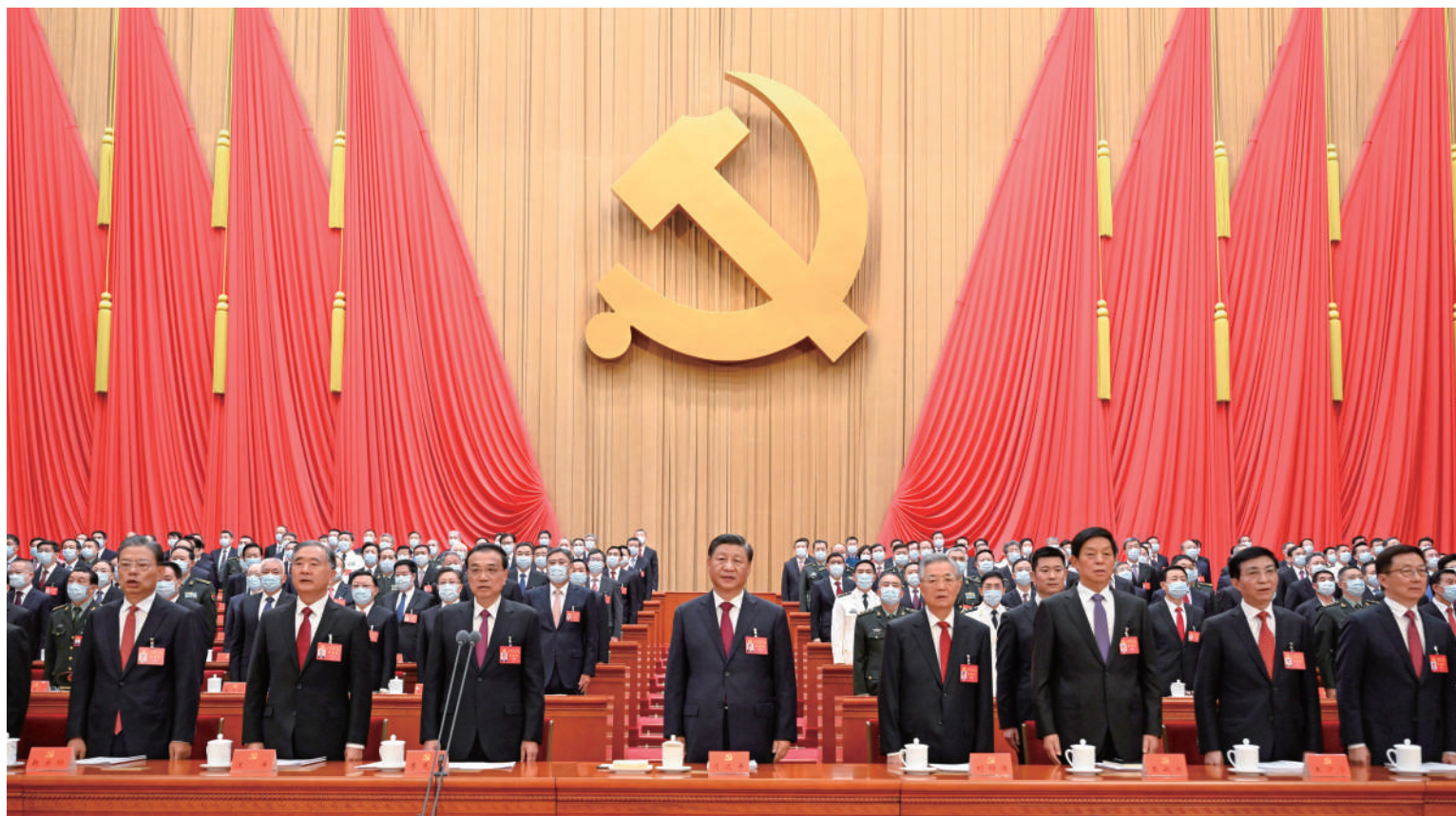
10月16日,中国共产党第二十次全国代表大会在北京人民大会堂开幕。这是习近平、李克强、栗战书、汪洋、王沪宁、赵乐际、韩正、胡锦涛在主席台上。

新华社北京10月16日电 凝心聚力擘画复兴新蓝图,团结奋进创造历史新伟业。举世瞩目的中国共产党第二十次全国代表大会16日上午在人民大会堂开幕。