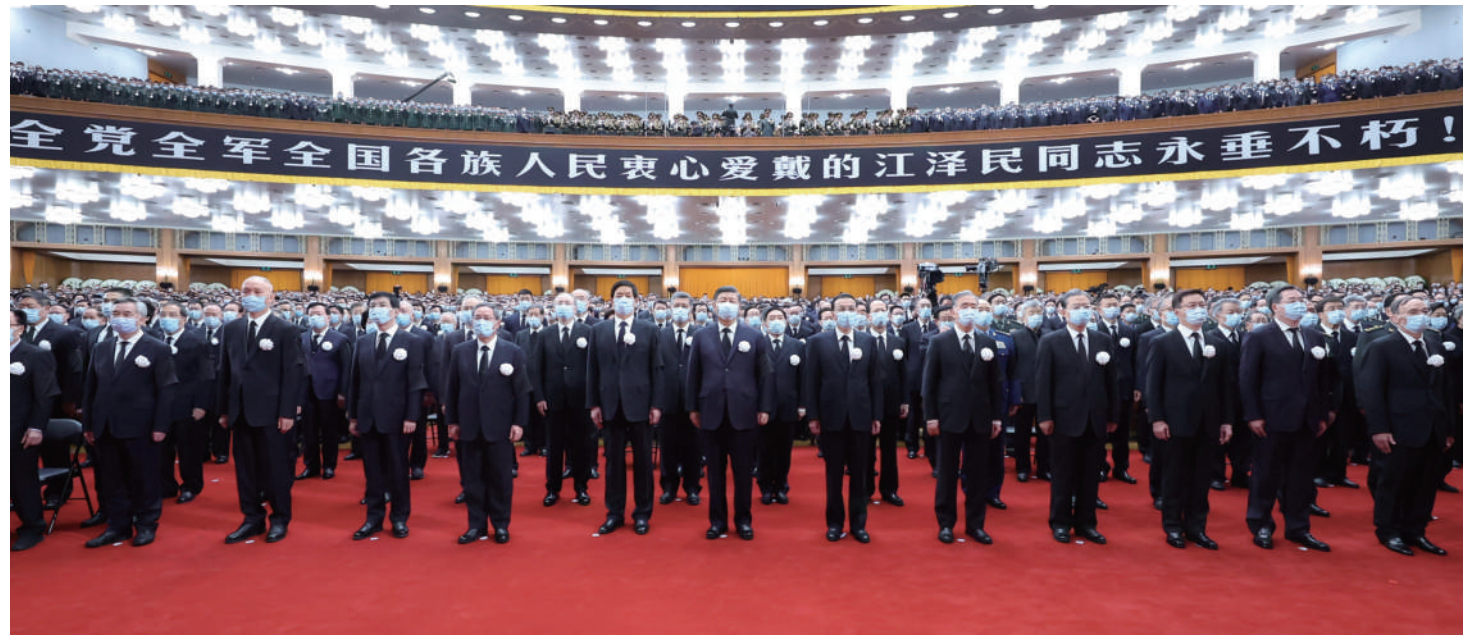
12月6日,中共中央、全国人大常委会、国务院、全国政协、中央军委在北京人民大会堂隆重举行江泽民同志追悼大会。习近平、李克强、栗战书、汪洋、李强、赵乐际、王沪宁、韩正、蔡奇、丁薛祥、李希、王岐山等参加大会。