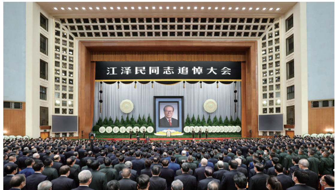
12月6日,中共中央、全国人大常委会、国务院、全国政协、中央军委在北京人民大会堂隆重举行江泽民同志追悼大会。

新中国成立后,江泽民同志先后在企业、科研单位、国家部委工作,在每个岗位上他都尽职尽责、艰苦努力,把火热年华献给了社会主义革命和建设事业,在改革开放方面做了大量开拓性工作。在党的十二大上,他当选为中央委员。(下转A2版)