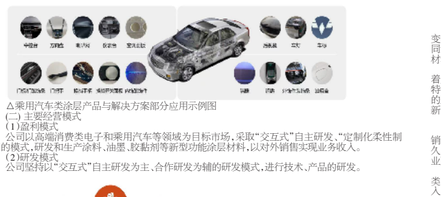
▲乘用车在内饰产品与解决方案部分应用示意图