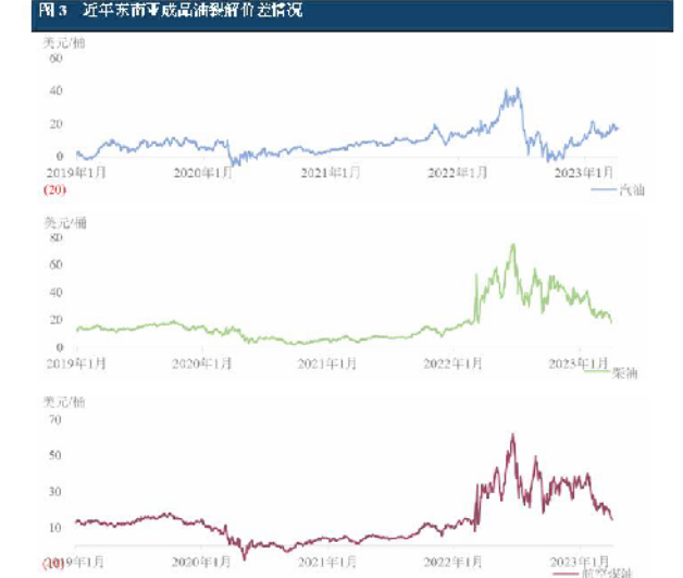
图3 近年原油与成品油裂解价差走势图 作为亚洲第一炼化巨头,从1979年至今新加坡石化产品裂解价差来看,2020年,成品油裂解价差处于历史最低水平...