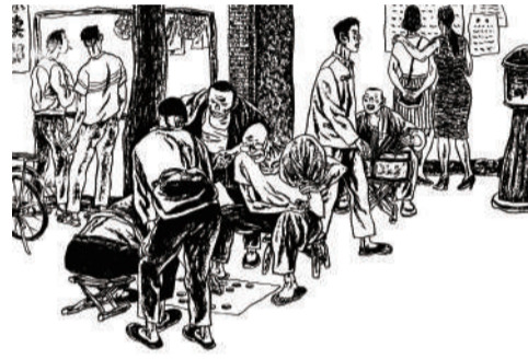
《平凡的世界》绘本书影