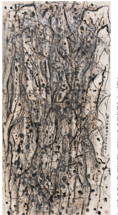
崔振宽 华山游图四 247.5cm x 123.5cm 纸本设色 2019年