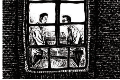
《平凡的世界》绘本书影