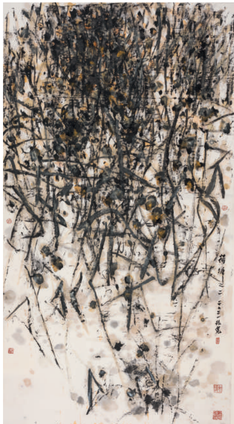
崔振宽 荷塘之二 180cm x 96.5cm 纸本设色 2021年

万万没想到老画家居然将笔触还伸向了喧闹的城市,描画了一组组森林般的水泥建筑。那些高楼犹如山峰,楼宇耸峙,窗扉对出,浓厚的雾霾之中独不见人影,使人更感到压抑沉重,急想逃离城市喧闹,回归自然田园故土,却似乎左冲右突难以走出迷宫般的街巷。实际上这正是位中国画家对现代意义的思考,反映了历史与现实的冲突,反映了生活的苦与甜,还通过水墨反映了前进中的阵痛和幸福里的忧患,其实就是一种悲悯的救赎。这种强烈的现代思维,深深地浸透进画家那一幅幅城市题材的水墨里了。(文/阿莹)