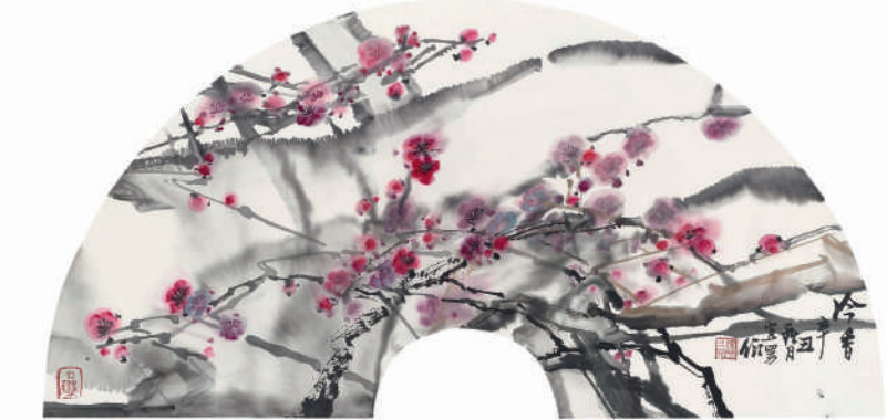
乔宜男 冷香 纸本设色 2021年

乔宜男的作品给我的第一感觉就是清、雅、静、高——清新、雅致、安静、高格调。乔宜男以前是画工笔的，现在改画写意，转型非常成功。他把中国文人画的笔墨意境语言完美运用，在观察大自然当中，将自己的