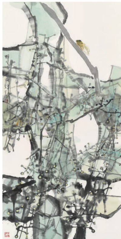
乔宜男 蝉鸣高枝 纸本设色 2001年

乔宜男，生于1968年。曾任西安美术学院办公室副主任、中国画系副主任，陕西省、西安市青年美术家协会主席，中国国家画院办公室副主任、主任、创作研究部主任。现为中国美术家协会会员，中国画学会理事，中国国家画院艺术委员会委员、花鸟画所所长。教授，国家一级美术师。作品曾获第十一届全国美术优秀奖及第三届全国工笔画展二等奖等。主编有《书画知识》《花鸟画名师创作录》。