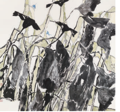
乔宜男 初日 170cm x 150cm 纸本设色 2004年