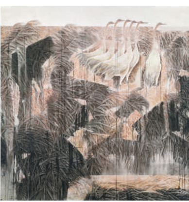
乔宜男 初日 170cm x 150cm 纸本设色 2004年