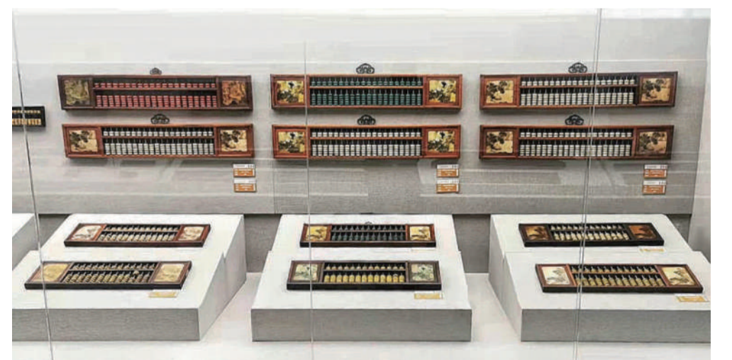
中国算盘博物馆展厅一隅

我们暂停拨弄算珠，才会看清算盘经纬天地的思想；我们会舍弃有形的算具，才会悟通无形的算理；我们停下忙碌的脚步，才能有时间琢磨生活的真谛。正如一首算盘诗写道： 七子之家隔两行，十全归一道沧桑。 五湖四海盘中算，三教九流珠上忙。 柴米油盐小黎庶，江山社稷大朝堂。 八方天地经营手，六六无穷今古章。 (转自微信公众号“曾广闻文”内容略有删节)