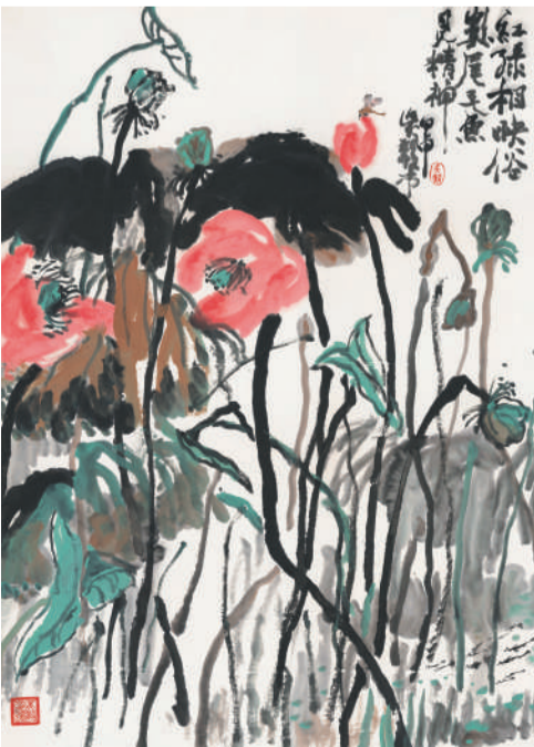
吴毅 荷塘清趣 95cmx69cm 纸本设色 2004年