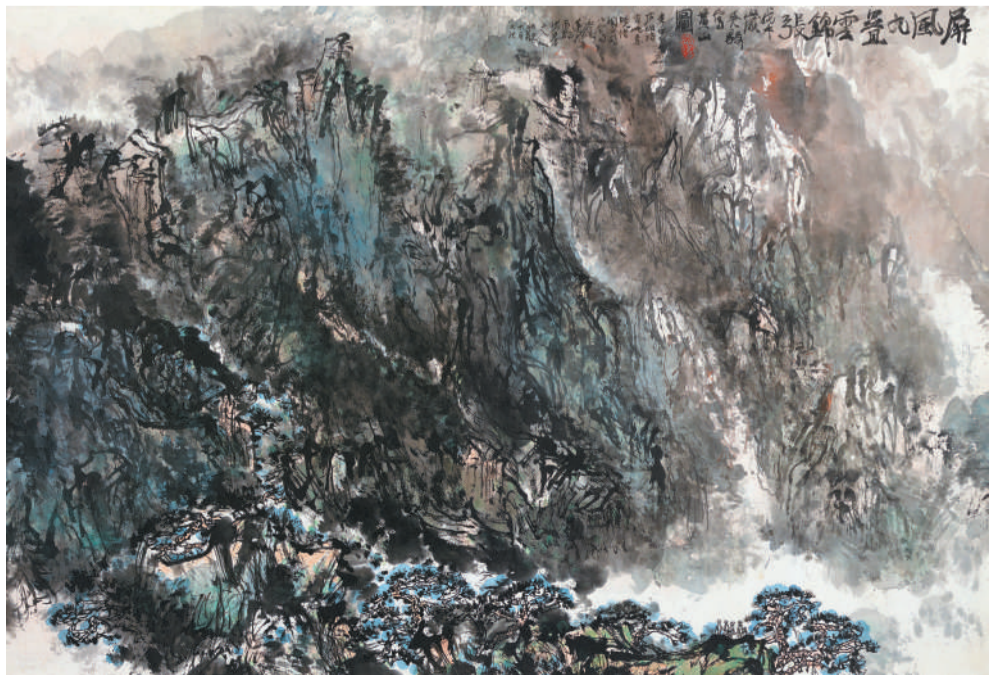
吴毅 屏风九叠云锦张 64cmx95cm 纸本设色 1978年