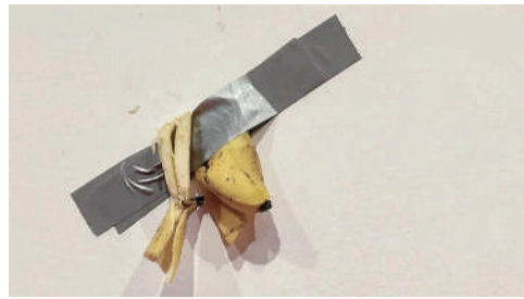
右图：2023年4月份《喜剧演员》在韩国展出时被一名大学生取吃下，该学生把吃剩的香蕉皮贴回墙上，并表示，作者想传达反抗当代艺术的理念，而反抗这种反抗也是一种反抗，“食物贴在那里就是给人吃的”。

启发了一种新的认识”。其后，画商和策展人与他达成协议，将《泉》复制多件展览于世界多地，成为美国费城艺术博物馆、法国巴黎蓬皮杜艺术中心等著名机构的藏品。2004年，《泉》还被500位英国艺术家、艺术史学者选为20世纪最具影响力的艺术品。让现成品摇身变为著名艺术品的不只杜尚，还有用肥皂盒创作《布里洛的盒子》的安迪·沃霍尔、用鲨鱼标本创作《生者对死者无动于衷》的达明·赫斯特等。