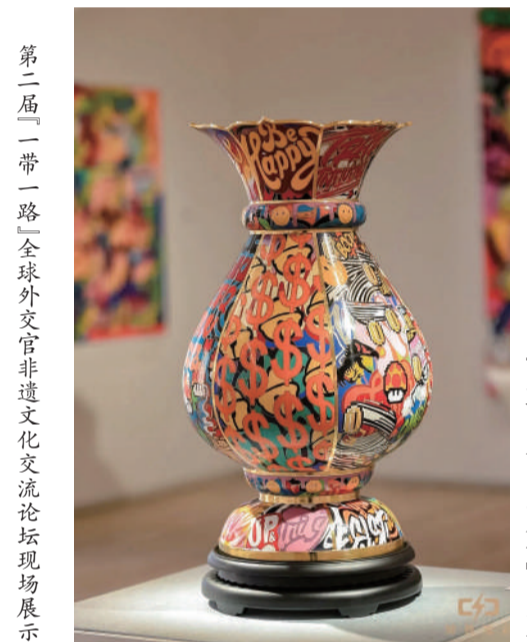
第二届“一带一路”全球外交官非遗文化交流论坛现场展示