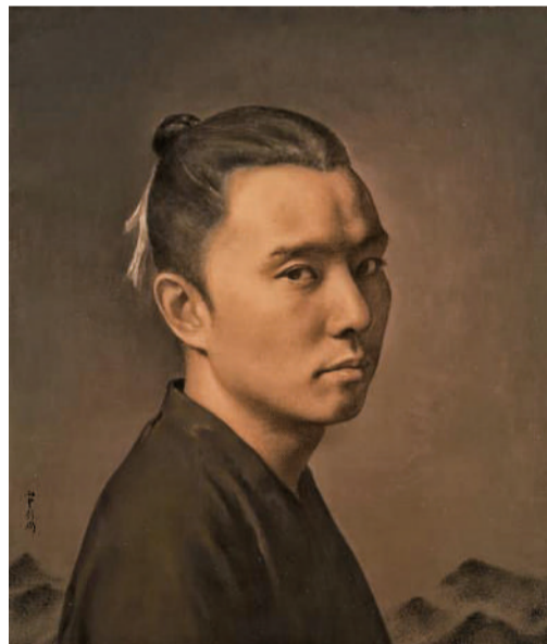
彭斯 山水少年 油画 40cm x 34cm 2016年