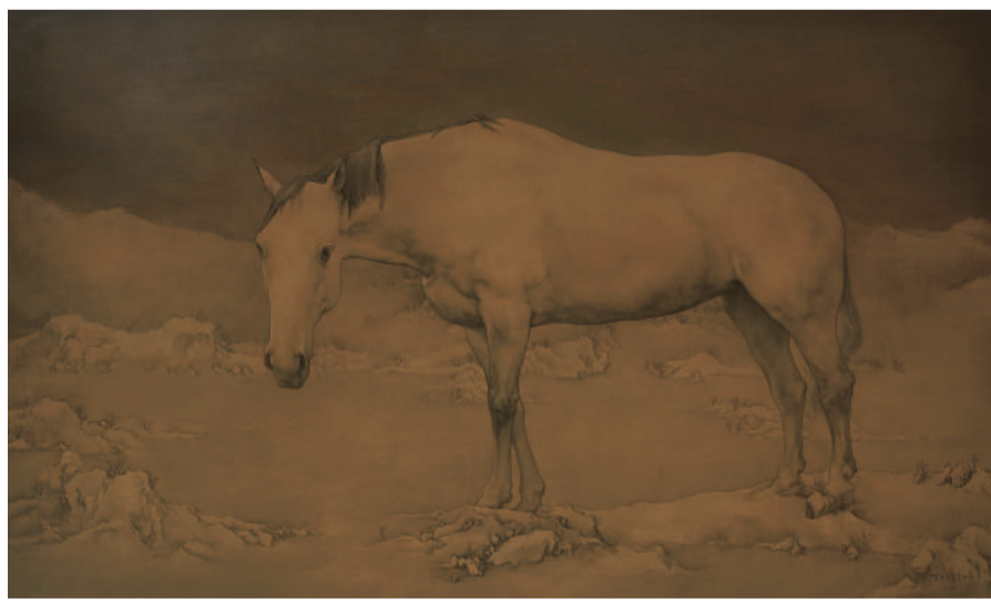
彭斯 寒江行吟图 油画 140cm x 240cm 2009年