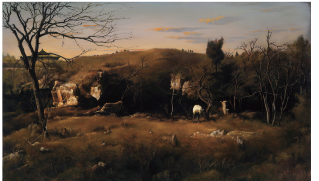
彭斯 鱼山晚照 油画 140cm x 240cm 2010年