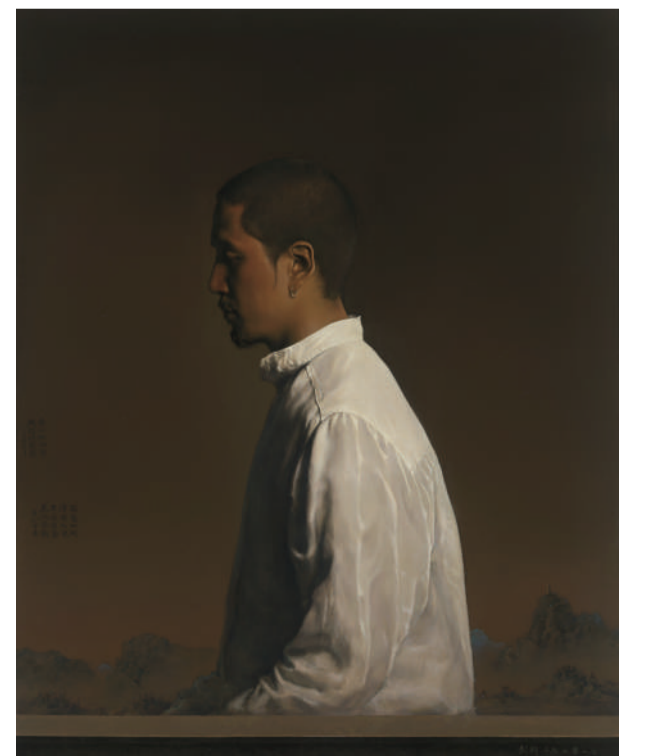
彭斯 聆听 油画 138cm x 118cm 2011年