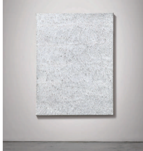
草间弥生 1959年作 无尽的网#4(油画) 2019-04-01 香港苏富比 成交价6243万港元

推出“IN THE NAME OF LOVE”为主题的帆布包。在更为广阔的艺术语言系统中，她的艺术与诸多流行符号共振，成为全世界都认识的艺术财富。她被英国《泰晤士报》评为20世纪最伟大的艺术家，被美国《时代》周刊誉为世界现存最伟大的艺术家，被美国艺术网站My Modern Met评为21世纪十大前卫艺术家，被英国 Art Newspaper 评选为全球最受喜爱的艺术家，不仅是因为艺术，更是关于财富。