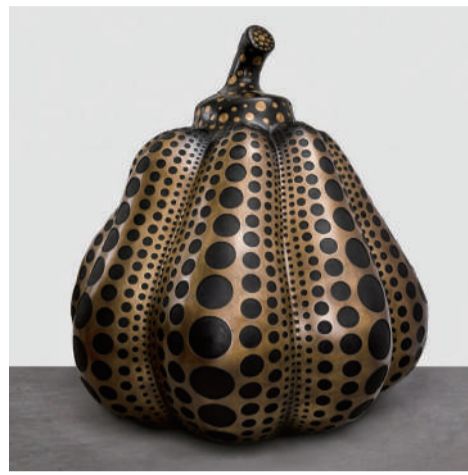
草间弥生 2014年作 南瓜(L)(雕塑) 2023-04-05 香港苏富比 成交价6264万港元

草间弥生1990年代开始与众多流行品牌合作，比如与路易威登合作推出Yayoi Kusama for Louis Vuitton系列包袋皮具、高级成衣、珠宝配饰，与可口可乐合作推出纪念款可乐和自动贩卖机，与服装潮牌X-LARGE合作推出“X-girl x 草间弥生”系列，与纽约现代艺术博物馆合作推出艺术滑板系列，与京东合作