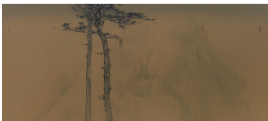
彭斯 双松帖 油画 120cm x 300cm 2016年