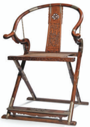
明末清初黄花梨麒麟纹圈背交椅 2021年5月香港佳士得 成交价6598万港元