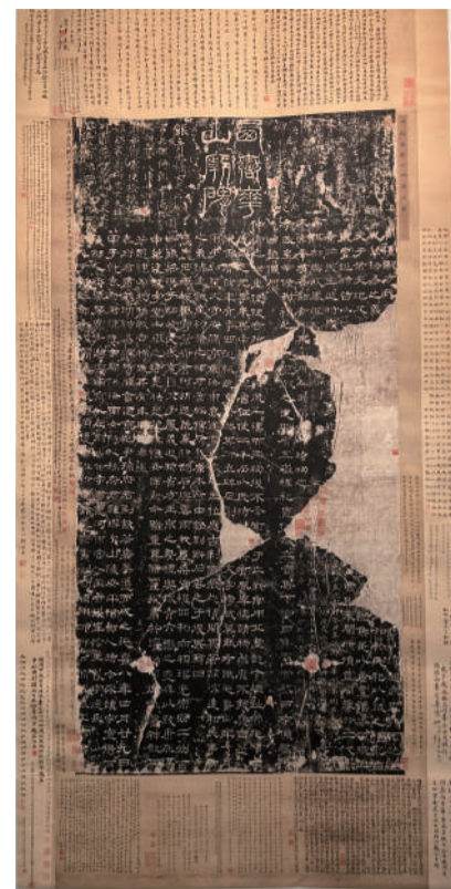
《汉华山庙碑(四明本)》

其中这件《汉华山庙碑》整拓本在书史上地位极高,原碑于东汉延熹八年(公元165年)立于华山。碑文正文使用隶书书写,为成熟的八分书,波折优美,极具庙堂气度。刘熙载在《艺概》中写道:“若华山庙碑磅礴郁积,流离顿挫,意味尤不可穷。”清代书法家金农以隶书见长亦有“华山片石是吾师”的感慨。遗憾的是华山碑后因灾害被毁,残石未存。所以华山碑汉原石拓本传世甚少,现存包括长垣本、顺德本、四明本、华阴本四本。其中四明本整副全拓,为四明道生所藏,可窥华山碑全貌,极为珍贵。该拓本1975年由胡惠春捐文化部文物局,现存于故宫博物院。