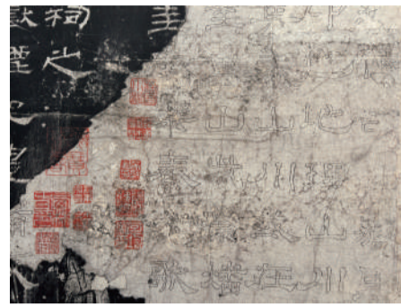
《汉华山庙碑(四明本)》局部

近日保利艺术博物馆举办了一场名为“希世之宝”的善本碑帖特展。本次展览将20世纪90年代以来保利收藏的顶级善本碑帖齐聚一堂。全展共有十八种碑帖,包括宋元拓本中传世所见最旧版本《秦石鼓文》、宋拓善本唐碑欧阳询书《九成宫醴泉铭》以及四明本《汉华山庙碑》(复制品)等。