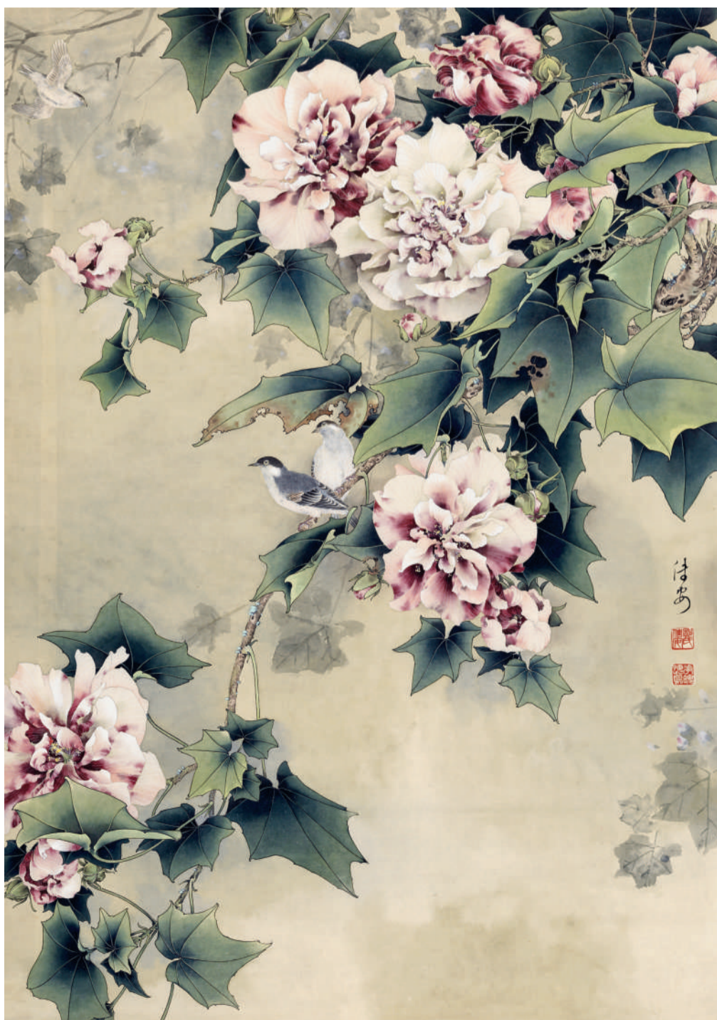
邹传安 芙蓉 96.8cm x 67.5cm 纸本设色 1982年 中国美术馆藏