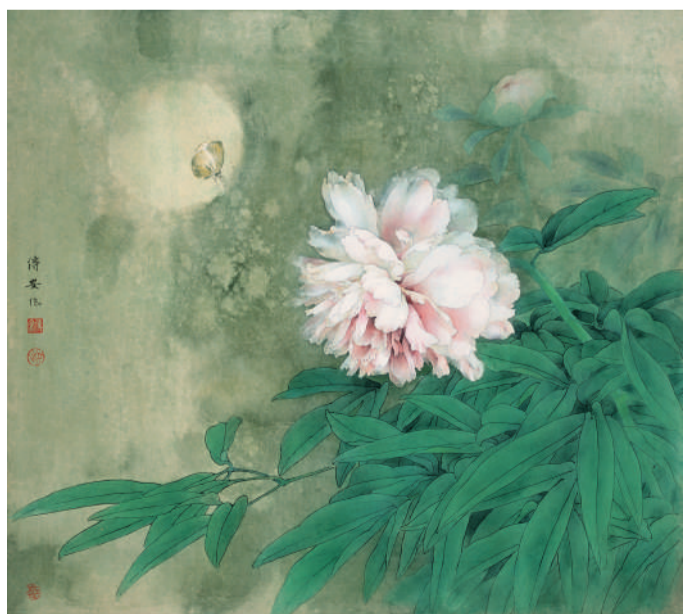
邹传安 花月无言 41cm x 51.2cm 纸本设色 湖南博物院藏