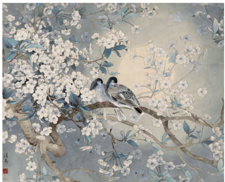
邹传安 梨花纹鸟 34cm x 65cm 纸本设色 1982年 中国美术馆藏