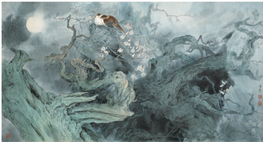
邹传安 古霄凌烟月上时 95cm x 173cm 纸本设色 2010年 中国美术馆藏