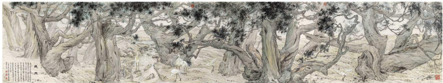
邹传安 岁月 95cm x 499cm 纸本设色 2017年 湖南博物院藏