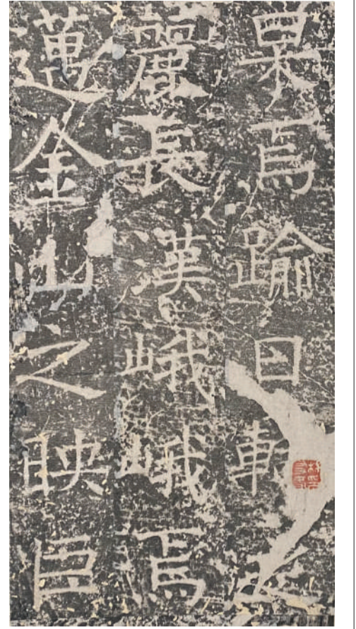
《伊阙佛龕碑》拓本内页