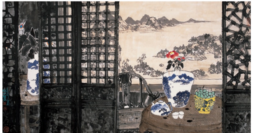
马硕山 雅室清韵 90cm×180cm 纸本设色 2011年