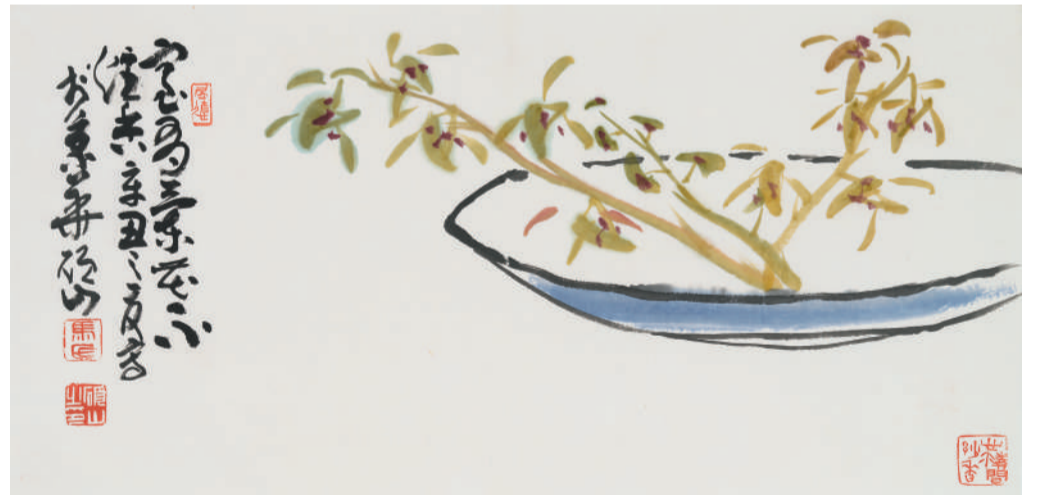
马硕山 室有兰花不炷香 34cm×68cm 纸本设色 2021年