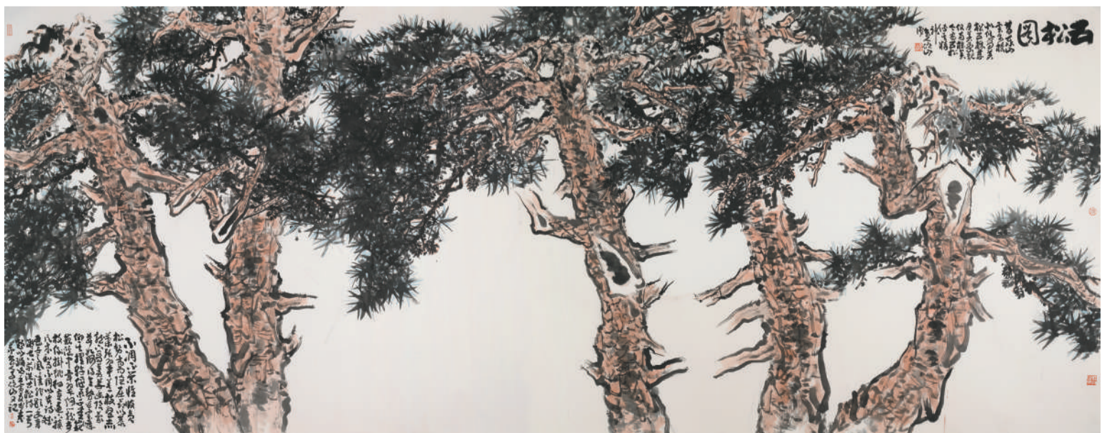
马硕山 五松图 219cm×543cm 纸本设色 2022年