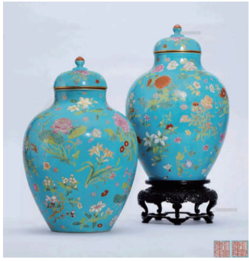
清乾隆 松石绿地洋彩描金折枝四季花卉纹盖罐成对 北京保利2023秋拍 成交价:RMB 14,950,000元