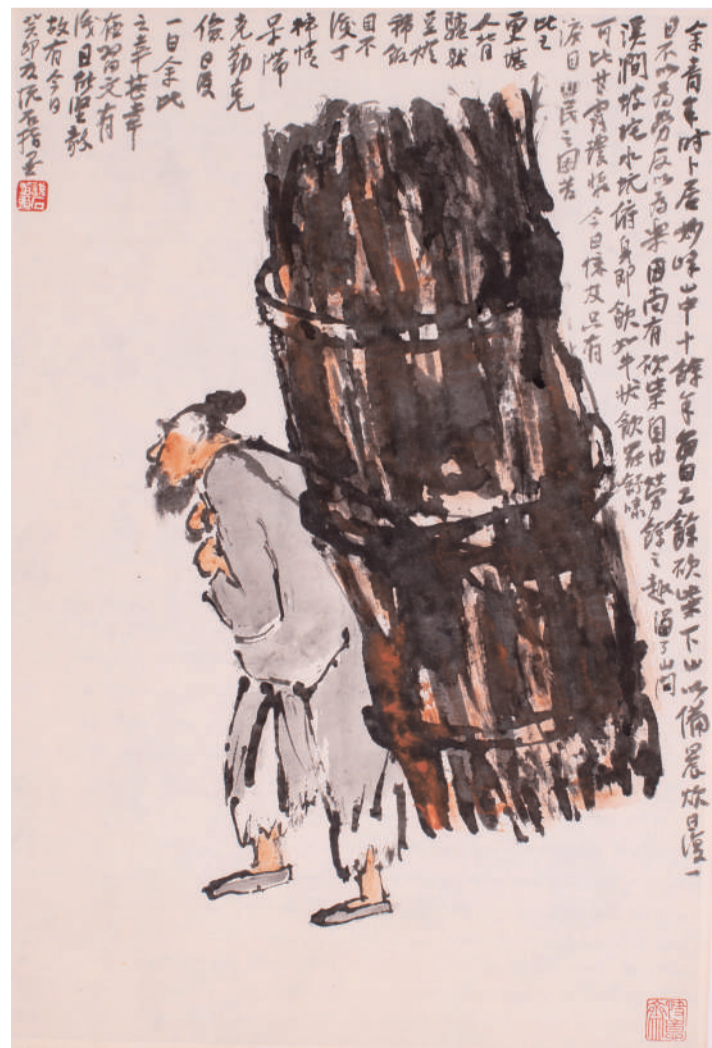
吴悦石 指画负薪图 纸本设色 2023年