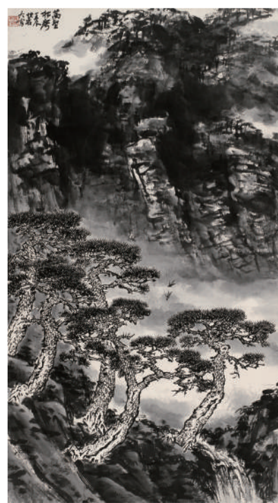
吴悦石 万壑松声 纸本墨笔 2012年