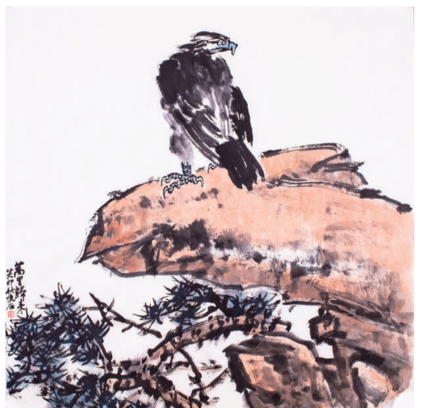
吴悦石 万里归来 纸本设色 2023年