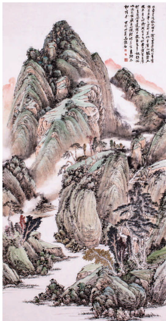
吴悦石 拟四王山水 纸本设色 2023年