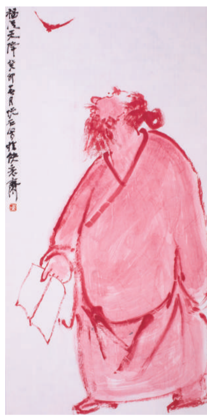
吴悦石 福从天降 纸本设色 2023年

的一代!”这是董寿平先生的期许,也指明了中国画的发展与前景。吴悦石先生是一名德艺双馨的艺术家,在求道、问艺、为人、处事方面皆为吾辈榜样。中华文化的伟大复兴最重要的还是从文化入手,在崇德立品、弘扬民族文化精神这一方面,需要如先生这般的有识之士。(文/何政广)