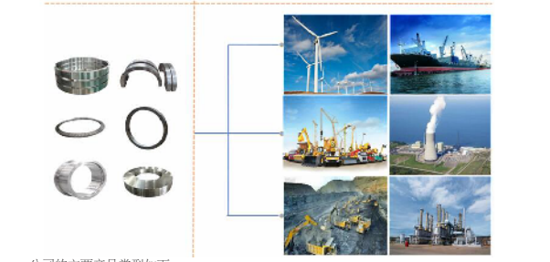
公司的主要产品类型如下:

1. 行业概述: 公司主要从事工业金属附件的研发、生产和销售,产品广泛应用于风电、工程机械、矿山机械、核电等多个行业。