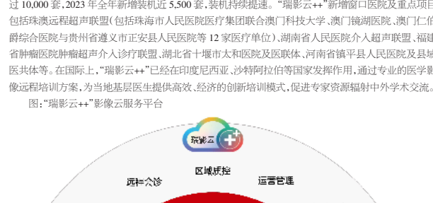
图:“瑞影云+”影像云服务平台

(2)数字化整体解决方案持续落地 报告期内,公司的数字化整体解决方案已经在国内外高端客户群中积累了大量的成熟案例,不断丰富、升级的人工智能应用,助力公司“设备+IT+AI”的智慧医疗生态持续快速发展。