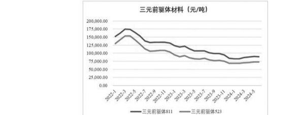
(6)正极材料市场价格走势图