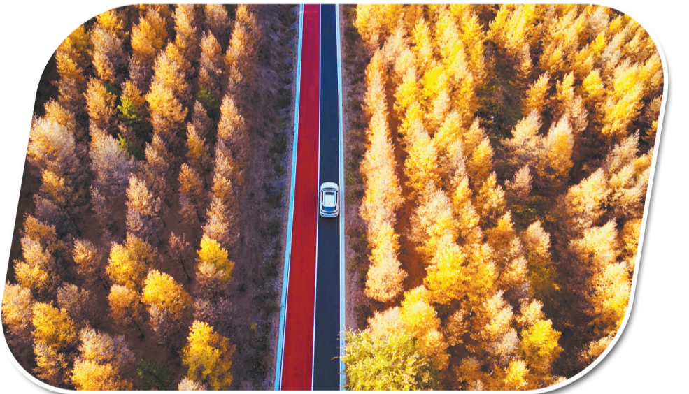
层林尽染的秋季公路风光