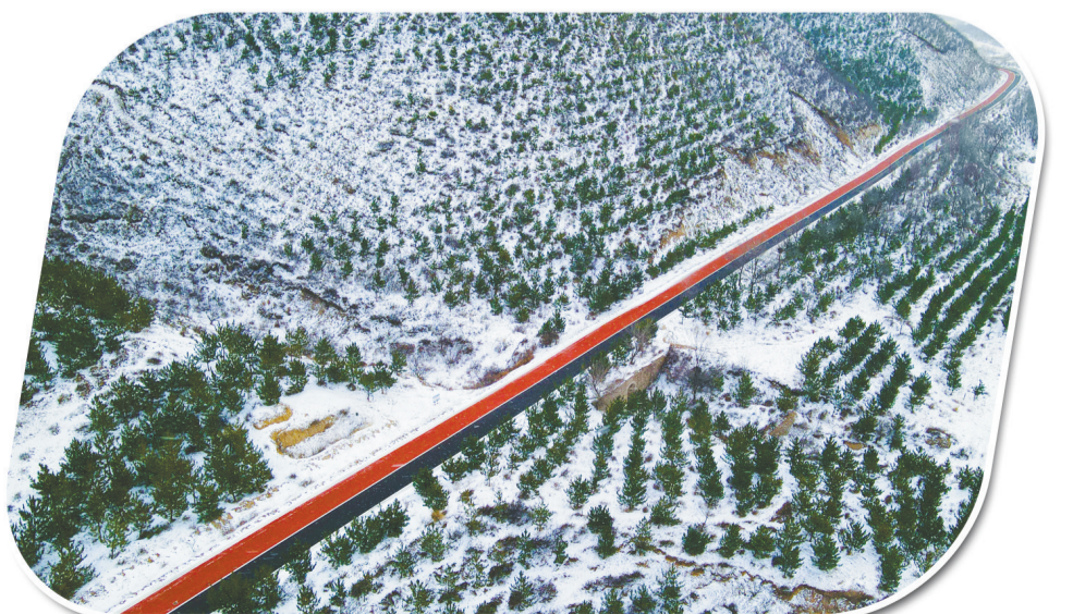
白雪皑皑的冬季农村公路