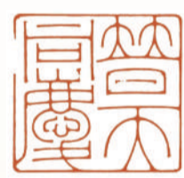
冯宝麟 晋天同庆(朱文)