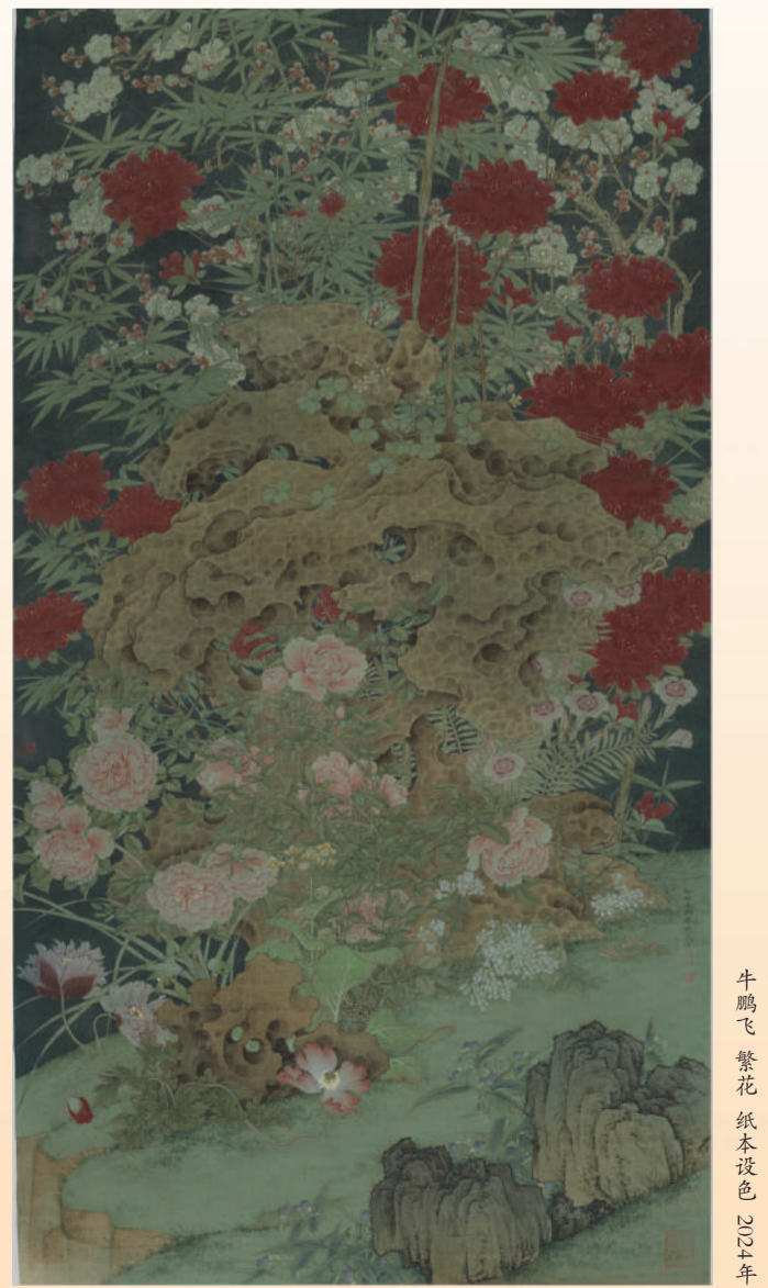
牛鹏飞 繁花 纸本设色 2024年