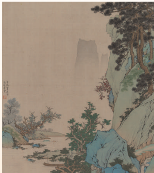
刘志明 春山 绢本设色 2024年