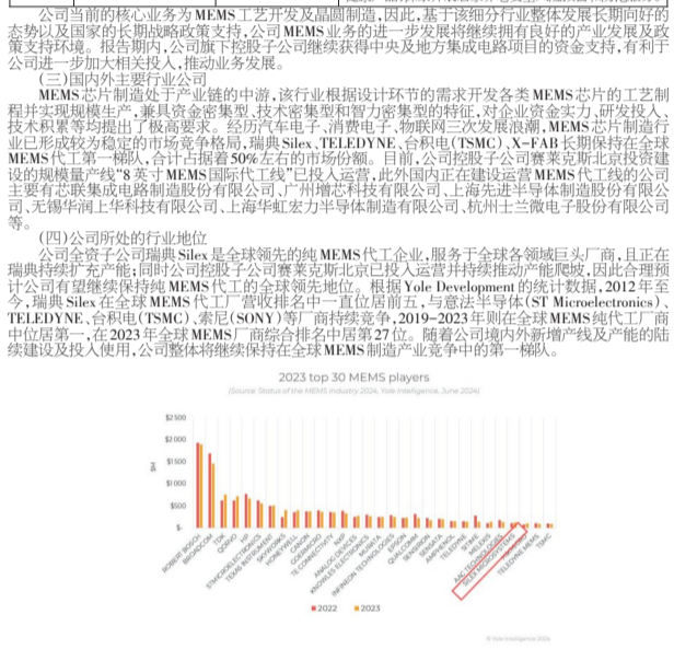
图3 全球MEMS市场展望 MEMS市场预计将在未来几年保持高速增长,主要受益于消费电子和工业控制领域的强劲需求。

图2 公司MEMS产品应用领域 MEMS产品广泛应用于消费电子、工业控制、汽车电子、航空航天等领域。