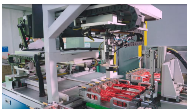
图六 电子雷管生产线

三、主要业务与经营模式 (八)主要业务与经营模式 7. 民用爆破器材生产与销售 民用爆破器材生产与销售是公司传统业务之一,是公司服务业务的上游环节。