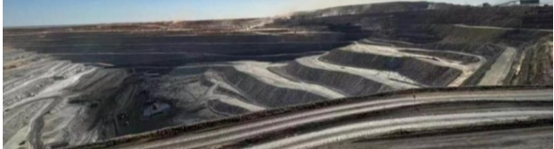
图三 新疆三塘湖煤矿项目

报告期内,公司防务装备板块不断加大产品体系重点配套产业投资力度,坚持围绕产业主体,充分发挥平台功能,聚焦产业主体,高质装备等领域发展。