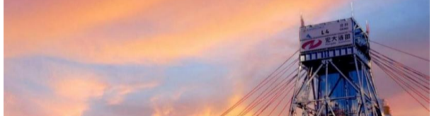
图四 塞尔维亚维多格塔铜矿项目

报告期内,公司防务装备板块不断加大产品体系重点配套产业投资力度,坚持围绕产业主体,充分发挥平台功能,聚焦产业主体,高质装备等领域发展。