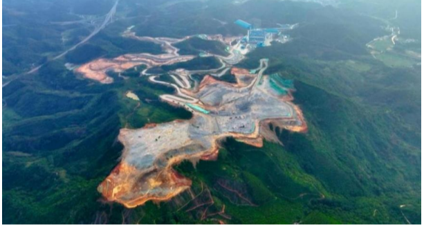
图一 肇庆大排智能矿山项目

三、主要业务与经营模式 (一)主要业务与经营模式 1. 矿山工程服务 主要采用工程施工总承包服务模式为客户提供服务,部分施工领域采用专业分包模式。