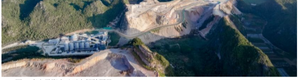
图二 南宁马山岭露天铁矿项目

报告期内,公司收购了宜春市民生化工有限公司60%股权、青岛盛普世天科技有限公司51%股权,合计新增产能8.2万吨,将其富余产能转移至新嘉矿地区,进一步推动公司矿服务业务,提升业务规模。