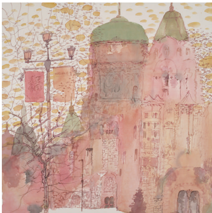
卢禹舜 哈尔滨写生系列之一 33cm×33cm 纸本设色 2025年