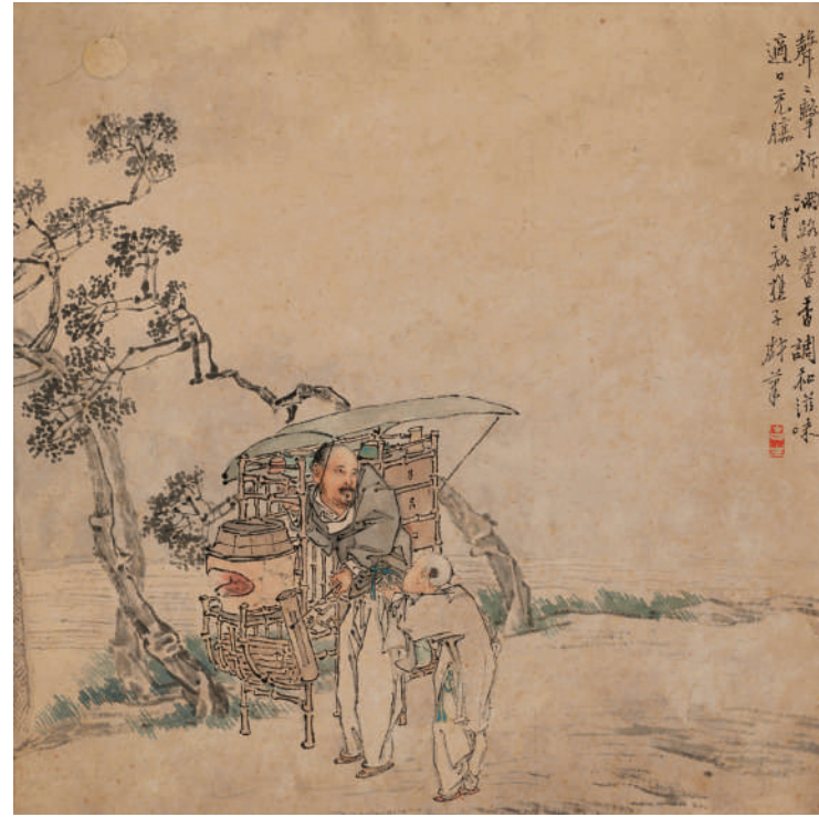
[清]钱慧安 人物册(选一)

慧安(1833—1911),初名贵昌,字吉生,号淡樵子、双管楼。一作宝山(今属上海市)人,一作浙江湖州人,一作仁和(今杭州)人,侨居上海。善人物、仕女,多作历史故事、吉祥题材。学仿费丹旭、改琦,同时吸收了民间年画的绘画特点,俗中见雅,令人耳目一新。图绘商贾、手工业者及市井生活场景,人物脸型丰盈,身材瘦削,衣褶作铁线描及钉头鼠尾描,细直刚硬,淡彩渲染,情节生动。一开款识为:“声声击柝,满路馨香。调和滋味,适口充肠。清溪樵子戏摹。”铃“吉生”“白文印”(见图)。另一开款识:“平安一统万年清。锦衣指挥使吕廷振本。清溪樵子。”铃“吉生”“朱文印”。每开均以题诗点明主旨,诗画应和,诙谐而耐人寻味。(文/刘妹伊)