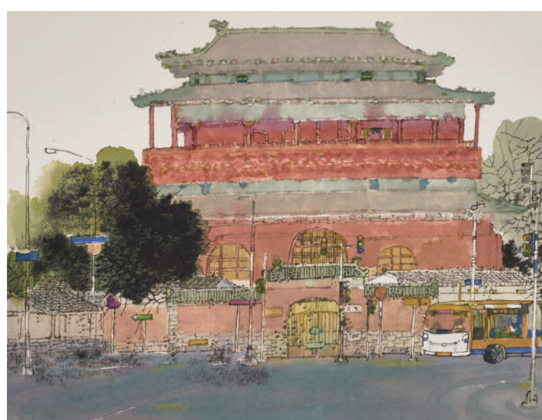
卢禹舜 中轴线写生 33.5cm×45cm 纸本设色 2025年