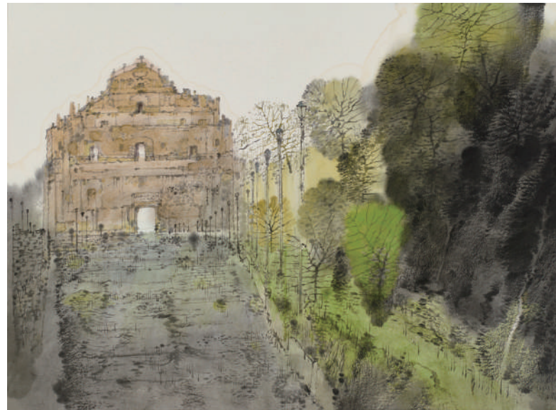
卢禹舜 澳门写生 38cm×52cm 纸本设色 2018年