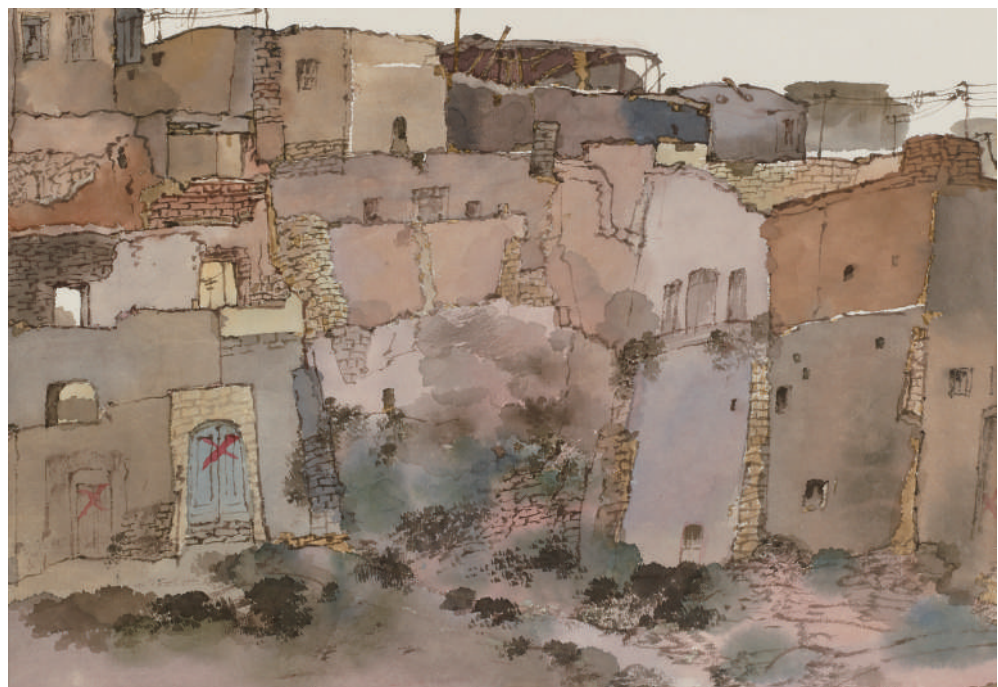
卢禹舜 新疆写生 23cm×33cm 纸本设色 2017年

实践,落到实处就是对写生、对景抒情、对景造境。概括起来讲有如下过程,投入自然、拥抱自然、感受自然、理解自然;忠于自然、主宰自然、超越自然、创造自然。这个过程若分为两段的话,上阶段就要像范宽一样,面对自然山川“危坐终日,纵目四顾,以求其趣”,以至于雪夜之际“必徘徊凝览以发思虑”而终得“山川造化之机”,这是对自然的认识和理解。后一阶段则应具体实践,在宣纸上用写实写意的笔墨语言与造化进行实际的接触,既不作造化的奴隶,也不作造化的叛逆,要尊重自然、主宰自然,夺造化创自然。要勤于实践,勤于动笔,化用自然全凭于此。有道是“实践不一定能造就出画家,但不实践永远不会造就出画家”,这是千真万确的道理。所以我说,选择了从事绘画这个专业,就是选择了艰辛和痛苦,留给人间完美的物质与精神,但留给画家的是一生的遗憾与身心的痛苦。自然之美、心中之美不会慨然于你我,在大家看到一挥而就、洒脱自然的背后是画家的沉重、痛苦和长期的积累。不动笔,不经过漫长的笔墨积淀难成就任何一位画家。(文/卢禹舜)