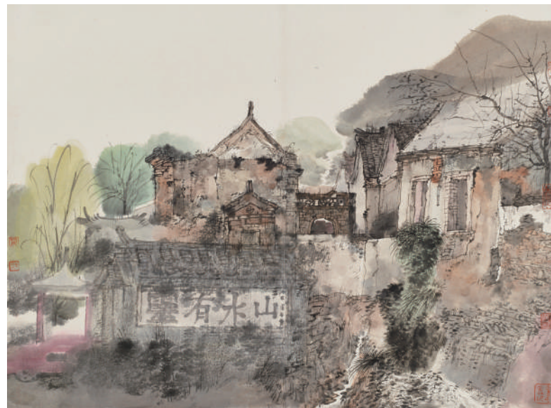
卢禹舜 灵水村写生 48cm×59cm 纸本设色 2017年