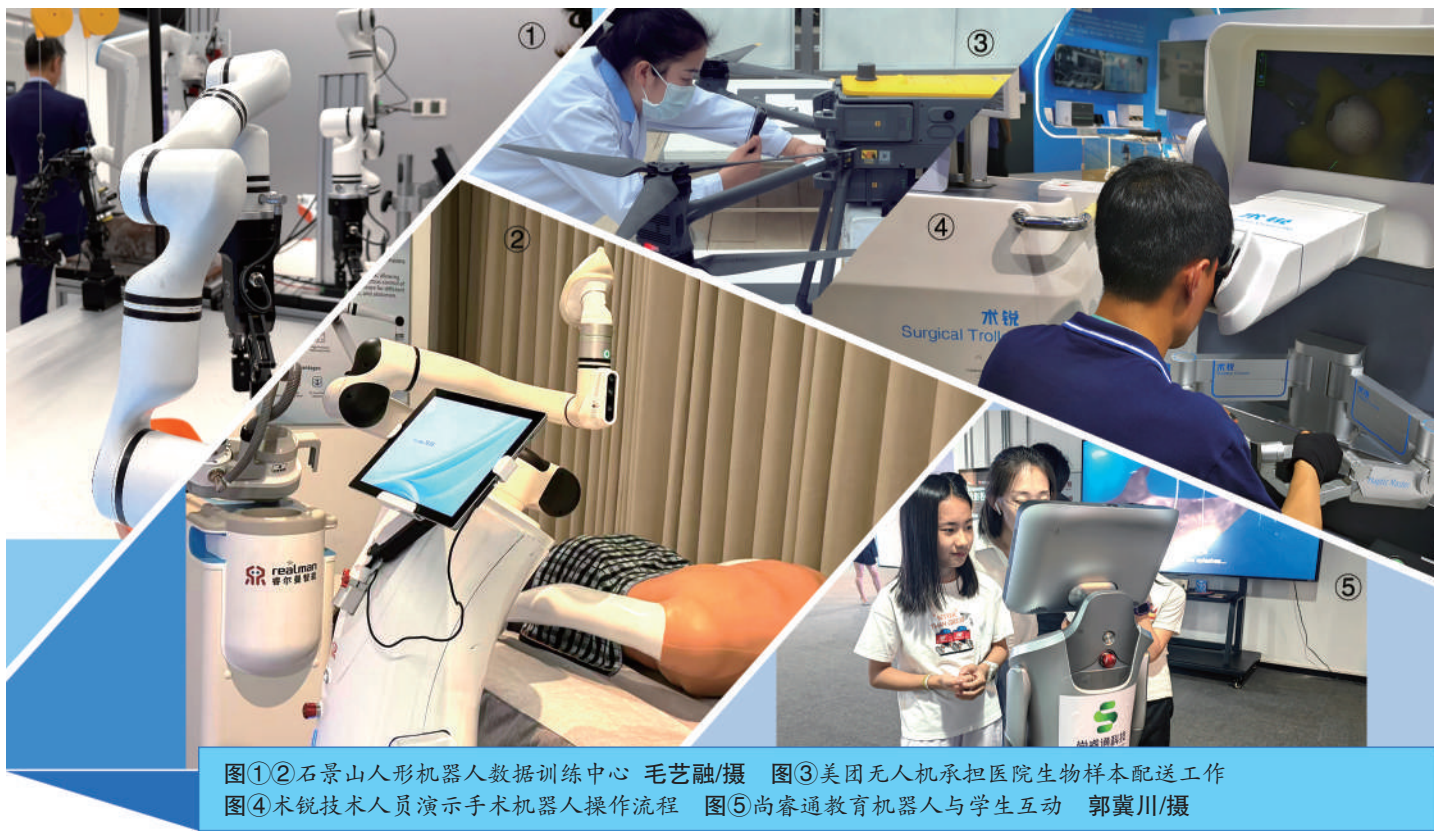
图①②石景山人形机器人数据训练中心 图③美国无人机承担医院生物样本配送工作 图④手术技术人员演示手术机器人操作流程 图⑤尚睿通教育机器人与学生互动

整体来看，大量机器人、无人机中小企业正面临“有技术、缺场景”“有算法、无数据”的困境。高昂的实地测试成本和低效的数据获取渠道，严重拖慢了产品化进程。在