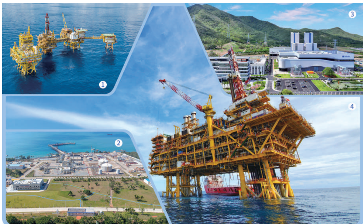
图①“深海一号”大气田二期项目 图②南山终端 图③华能南山电厂 图④东方13-2气田

高科技的产业,这些特点在深水领域尤为突出。”在调研现场,中国海油技术专家对《证券日报》记者表示。