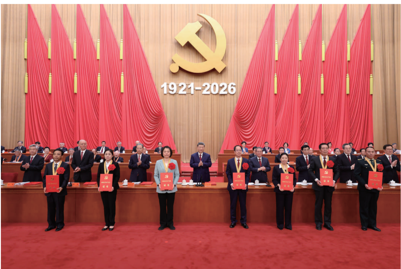
7月1日上午,庆祝中国共产党成立105周年大会在北京人民大会堂隆重举行。这是习近平等党和国家领导人为受表彰的全国“两优一先”代表颁奖。

习近平强调,实现新时代新征程党的使命任务,要求全体中国共产党人坚定信心、接续奋斗,不断创造无愧于时代和人民的新业绩。坚定信心、接续奋斗,必须坚持党的基本理论、基本路线、基本方略,坚持党的全面领导和党中央集中统一领导,深入贯彻新时代中国特色社会主义思想,坚定道路自信、理论自信、制度自信、文化自信,继往开来、守正创新,做到不畏浮云遮望眼、乘风破浪不迷航。必须紧紧依靠人民创造历史伟业,践行以人民为中心的发展思想,充分激发亿万人民的积极性主动性创造性,统筹推进“五位一体”总体布局、协调推进“四个全面”战略布局,完整准确全面贯彻新发展理念,加快构建新发展格局,扎实推动高质量发