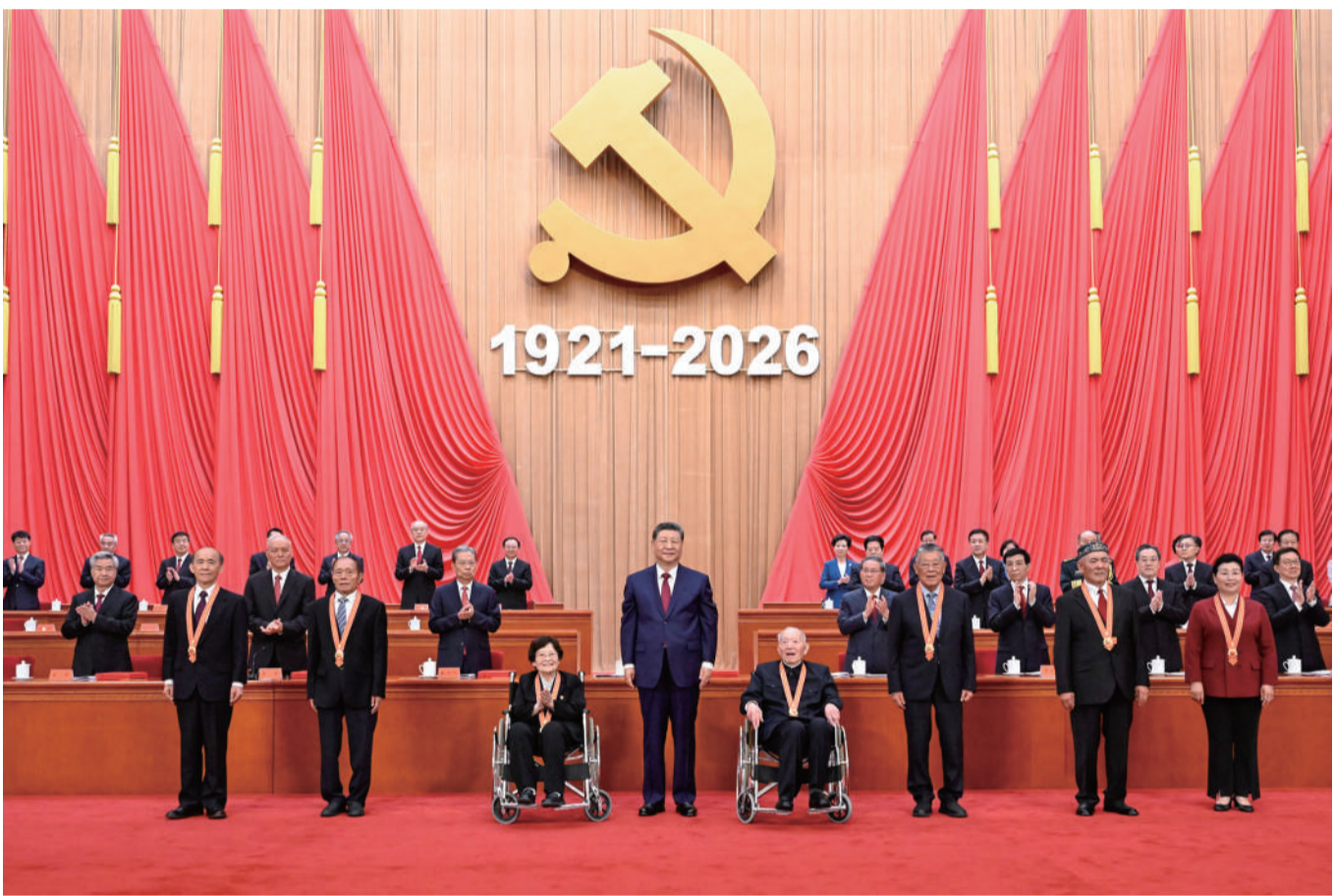
7月1日上午,庆祝中国共产党成立105周年大会在北京人民大会堂隆重举行。中共中央总书记、国家主席、中央军委主席习近平向“七一勋章”获得者颁授勋章。

新华社北京7月1日电 庆祝中国共产党成立105周年大会7月1日上午在北京人民大会堂隆重举行。中共中央总书记、国家主席、中央军委主席习近平向“七一勋章”获得者颁授勋章并发表重要讲话。他强调,105年来,我们党始终坚守为中国人民谋幸福、为中华民族谋复兴的初心使命,在不懈奋斗中创造了彪炳史册的伟大成就。新征程上,全党同志要坚定信心、接续奋斗,不断创造无愧于时代和人民的新业绩。